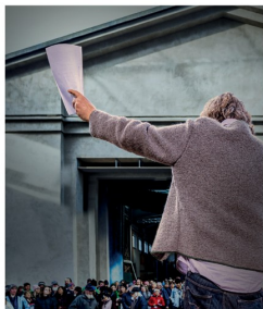
In der Menge

Guter Gott, die Stimmung ist aufgeheizt. Da sind so viele unterschiedliche Meinungen und Möglichkeiten. Meinen eigenen Standpunkt zu finden, ist nicht leicht. Hilf Du mir dabei. Amen.